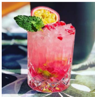
„Gin Caipirinha“ € 6,50

dry gin, cointreau, sugar, limes, pomgrenades, passion fruit, mint, and crushed ice